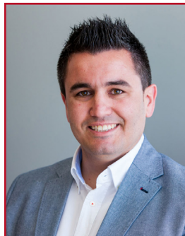
TONI ARENAS ALMENAR PSOE