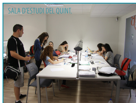
SALA D'ESTUDI DEL QUINT.