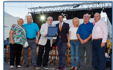
ENTREGA DE PREMIS I SOPAR POPULAR A LA PLAÇA MAJOR.