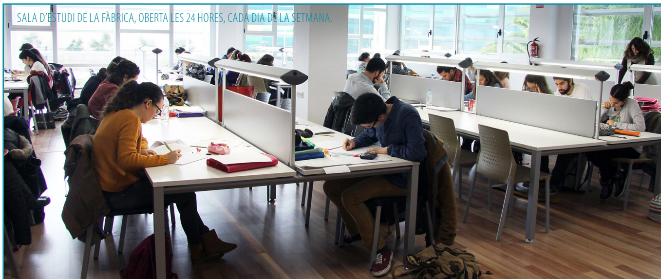
SALA D'ESTUDI DE LA FÀBRICA, OBERTA LES 24 HORES, CADA DIA DE LA SETMANA.

L'Ajuntament ofereix als joves de Mislata aules d'estudi amb professors de suport i sales de 24 hores amb les millors condicions per a preparar els exàmens