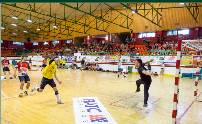
UNA DE LES FINALS DEL TROFEU, DISPUTADA AL PAVELLÓ DE LA CANALETA.