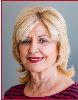
PEPI LUJÁN MARTÍNEZ PSOE