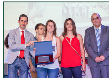
EQUIP FEMENÍ MISLATA CLUB DE FUTBOL