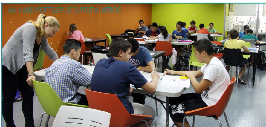
AULA AMB PROFESSORS DE SUPORT AL MERCAT

A tot açò, s'unia l'àmplia oferta que des de fa uns anys ofereix l'Ajuntament i que compta amb la sala d'estudi de La Fàbrica - que obri 24 hores al dia, cada dia de la setmana-, la del Quint -que obri fins les 22.30 hores- i la de la Biblioteca, on s'acaba d'instal·lar un mòdul amb ordinadors. En total, el Consis-