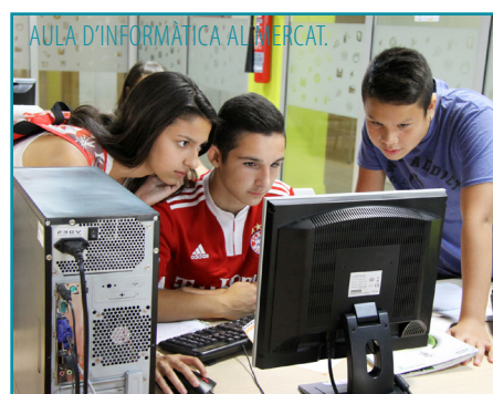
AULA D'INFORMÀTICA AL MERCAT.

tori ofereix prop de 300 places perquè els joves preparen els seus exàmens en un ambient propici per a l'estudi.