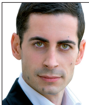
Carlos Fernández Bielsa Alcalde de Mislata