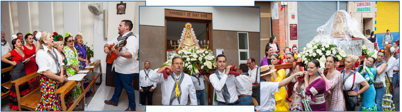
RECORREGUT DE LA IMATGE DE LA MARE DE DÉU DES DE LA PARRÒQUIA DE SANT MARC, FINS A L'ESGLÉSIA DE LA MARE DE DÉU DELS ÀNGELS.

la festa gran que té lloc en el poble onubense d'Almonte. Enguany, la pluja va fer acte de presència en alguns dels moments de la celebració, però finalment no va aconseguir deslluir esta singular festa dels andalusos de Mislata.