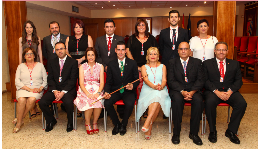
LOS 14 CONCEJALES Y CONCEJALAS QUE CONFORMAN EL EQUIPO DE GOBIERNO DE MISLATA.

Con la nueva distribución, la gestión del Ayuntamiento estará dividida en cinco grandes áreas: área de Promoción Económica,