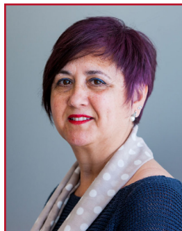
LOLA HORTELANO RAMÓN PSOE