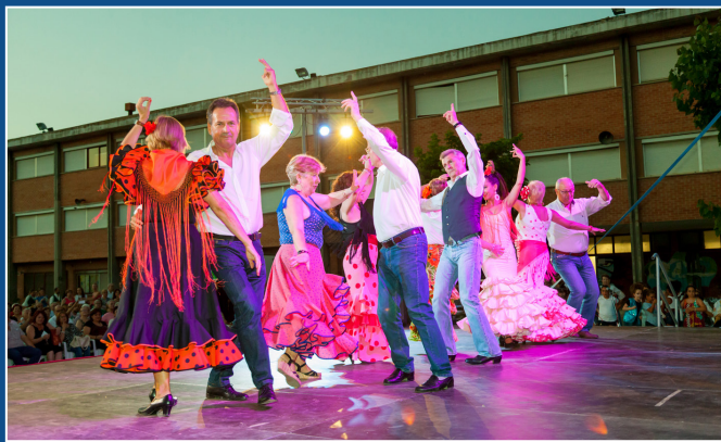
UN INSTANT DE LA GALA BENÈFICA MIRA QUIÉN BAILA EN MISLATA .