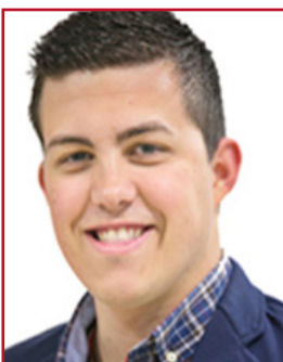
ALEJANDRO MARTÍNEZ MONTORO PP