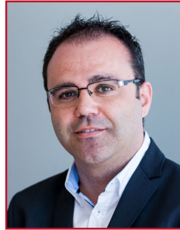
ALFREDO CATALÁ MARTÍNEZ PSOE